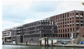
Quartier Bleu, Hasselt

luchtdichtbouwen@innoceal.com of bel naar 0488/66 14 66.