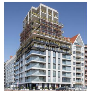
One Carlton, Knokke