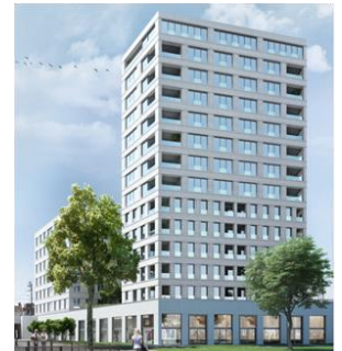
Qui Vit, Antwerpen