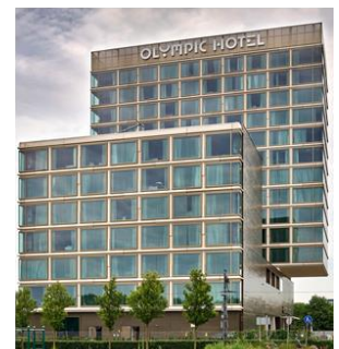
Olympic Hotel, Amsterdam