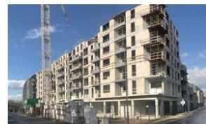
Bon Pasteur, Anderlecht