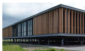
Energie Kenniscentrum Leeuwarden