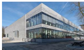
Earth Simulation Lab, Utrecht